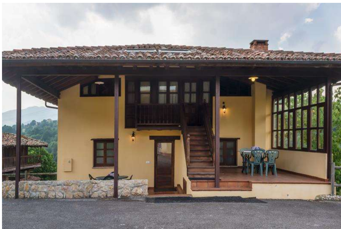
Fachada Norte, acceso a la Casa de la 2ª y 3ª Planta