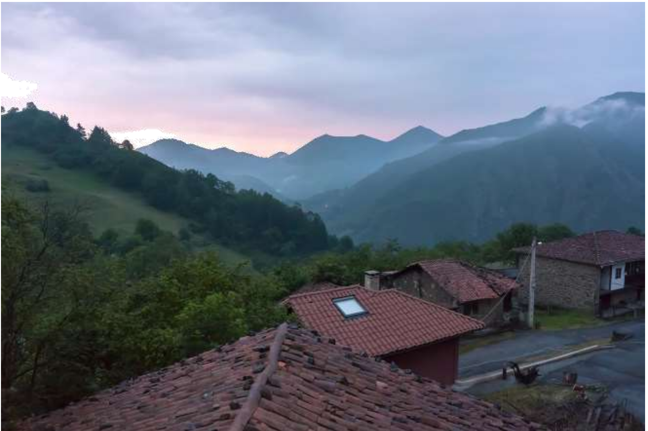
Vistas desde el salón, para disfrutar de un atardecer, desde aquí o desde la terraza de la habitación .... La foto está tomada al anochecer en día de lluvioso ... todo un lujo.