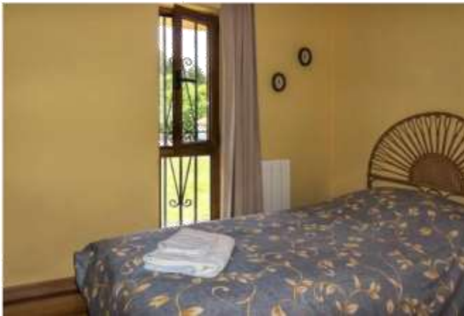
Dormitorio individual con acceso desde el dormitorio principal