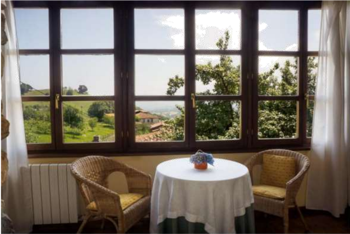
Aldea de Robledo de Cereceda (Cereceda - Villamayor)