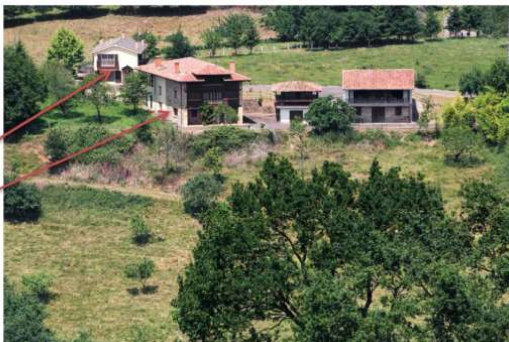
Casas Oriental y Casona Vistas Finca Soviña