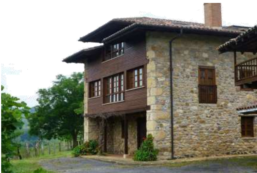
Facha Sur, acceso a la Casa de la 1ª Planta

Situación: Casa rural ubicada junto con otra magnífica construcción (Casa rural - vacacional Oriental) en una finca agrícola y ganadera ecológica, la Finca Soviña (Cereceda - Concejo de Piloña ), regada por un pequeño río truchero y hermosas vistas sobre los Picos de Europa y la Cordillera del Suevo. A 6 km. de Villamayor (N-634), a 20 km. de Arriondas, a 26 km. de Cangas de Onís y Covadonga y a unos 32 Km. de la playa de Ribadesella.